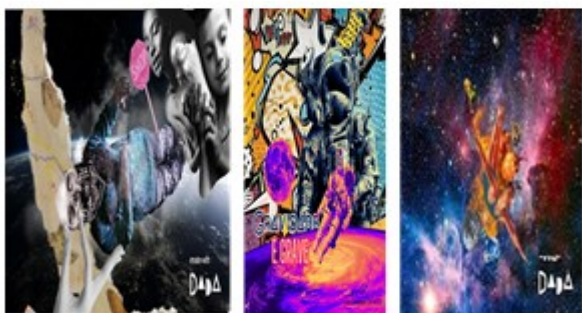
Figura 02. Trabalhos artísticos que será apresentado como exposição no Shopping.

Através da arte visual dentro de um conhecimento da astronomia busca analisar e entender pela percepção das diversas forma do ensino-aprendizado as mudanças ao comportamento humano pelo estudo da biologia. Toda construção dos discente pela arte visual, é trabalhado em um aplicativo chamado “DADA” para criação da arte pela colagem em fotografia, ao final do curso será realizado uma exposição ao público do Shopping Tacaruna, para apresentação e entendimento do conhecimento da astronomia (Figura 02).